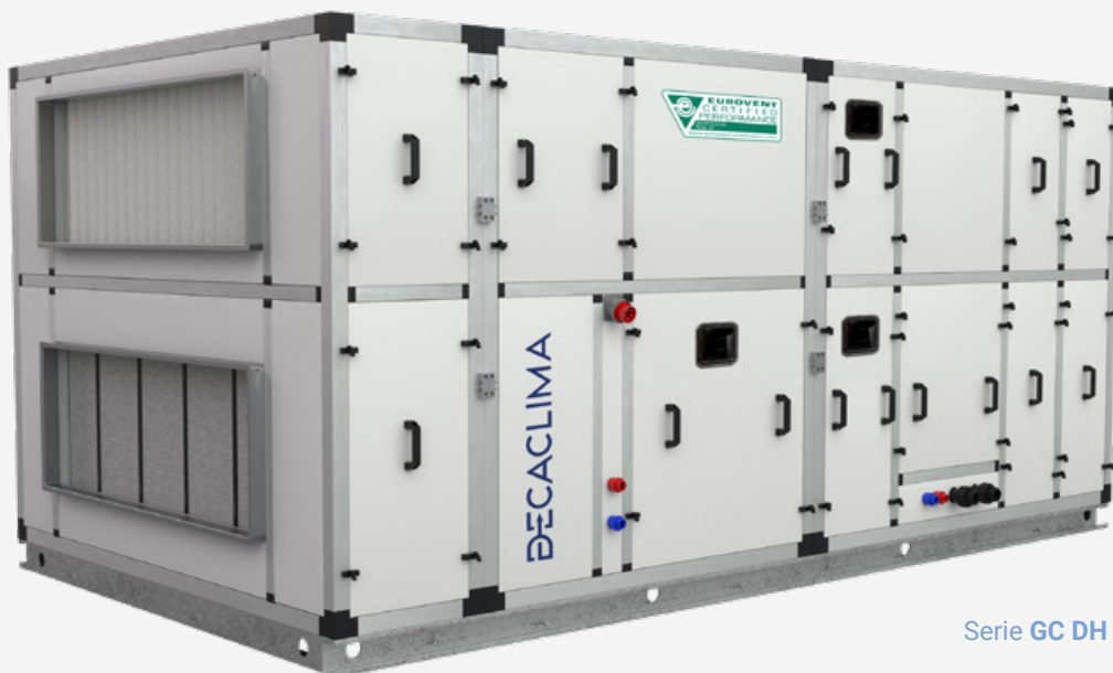
Serie GC DH