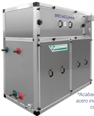
*Acabado exterior en acero inoxidable, solo como opcional

En entornos navales, la generación de vapor de agua por la evaporación natural en condiciones de alta humedad puede ocasionar daños en materiales constructivos, afectar el mobiliario a bordo y tener consecuencias adversas para las personas.